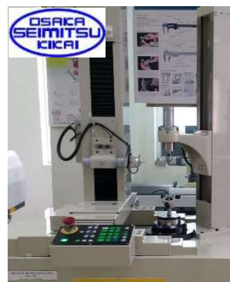
KIỂM TRA BIÊN DẠNG RĂNG