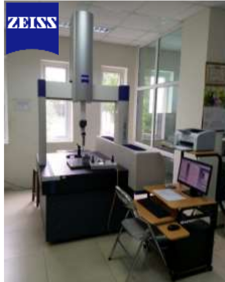
ĐO 3 CHIỀU TỰ ĐỘNG