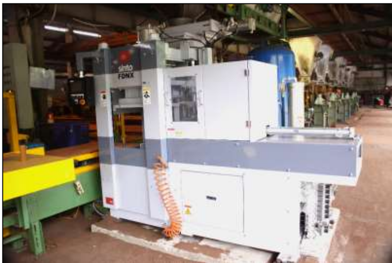
MÁY LÀM KHUÔN TỰ ĐỘNG