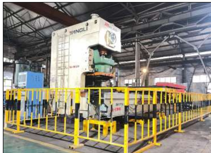
MÁY DẬP TÂM