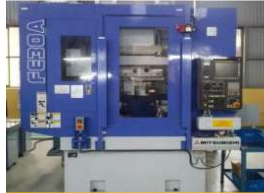
CÀ RĂNG CNC