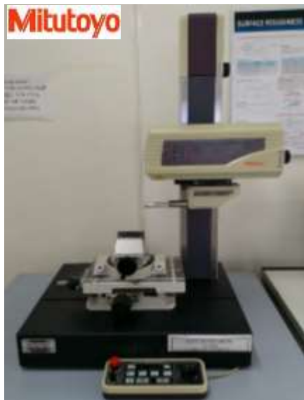
KIỂM TRA ĐỘ NHÁM