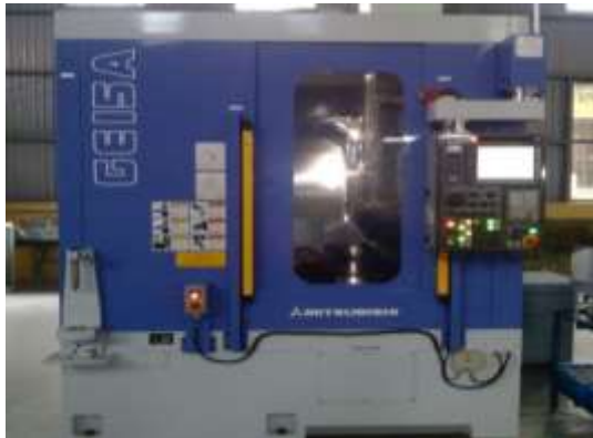
PHAY LĂN RĂNG CNC