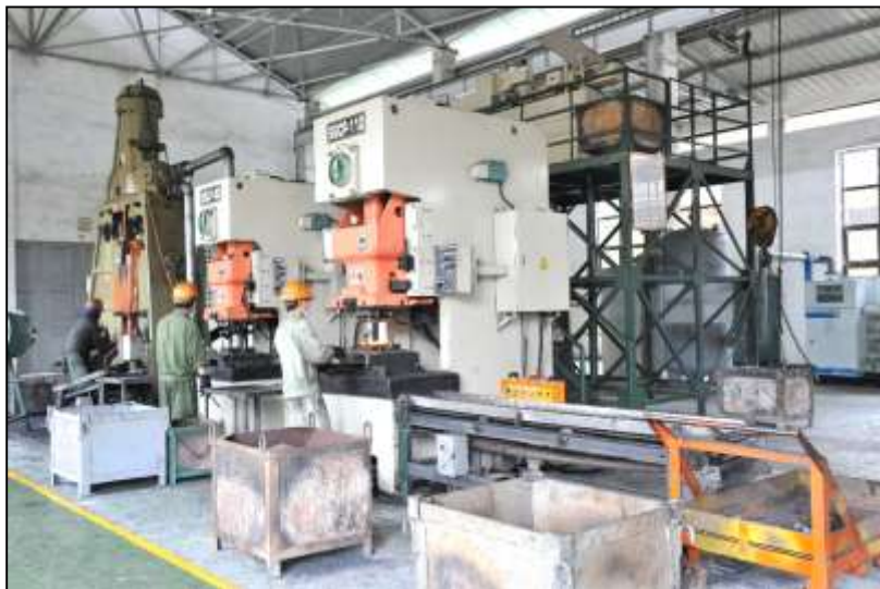
MÁY BỨA HƠI 1300