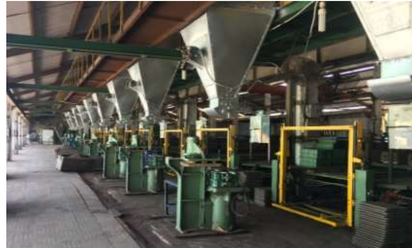
DÂY CHUYỀN ĐÚC (7.200 tấn/năm)