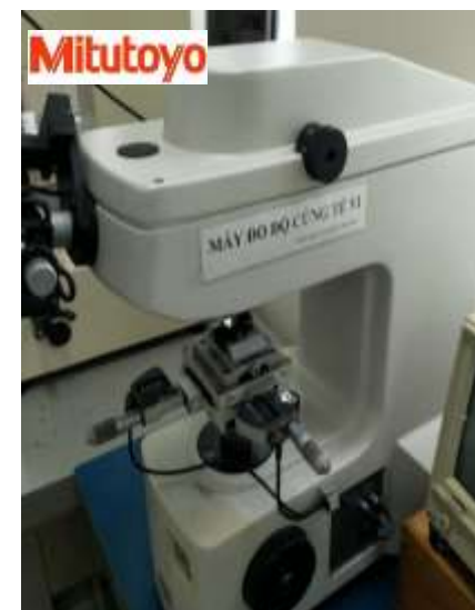
KIỂM TRA ĐỘ CỨNG