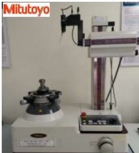
KIỂM TRA TRÒN TRỤ