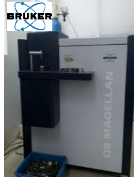
PHÂN TÍCH VẬT LIỆU