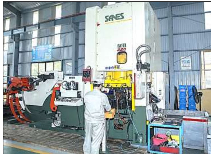
MÁY DẬP FINE BLANKING