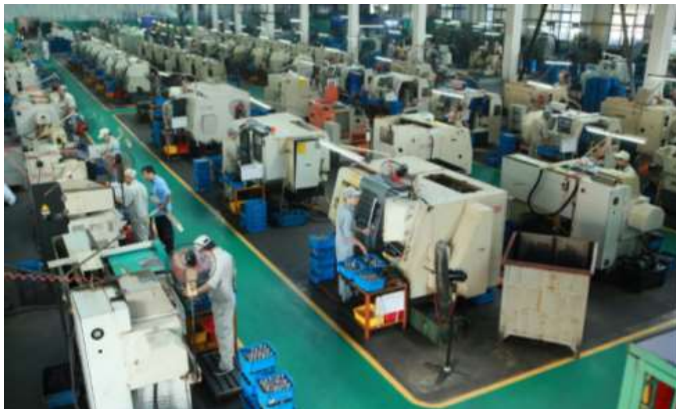
DÂY CHUYỀN GIA CÔNG CƠ KHÍ (40.000.000 sp/năm)