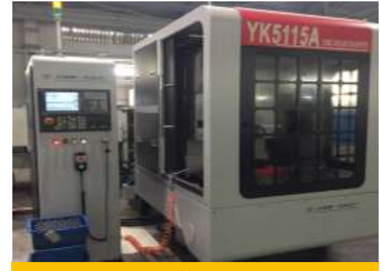
XỌC RĂNG CNC