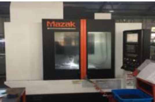
TRUNG TÂM GIA CÔNG