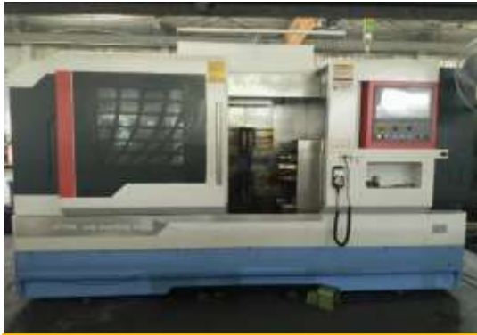
KHỎA MẶT KHOAN TÂM