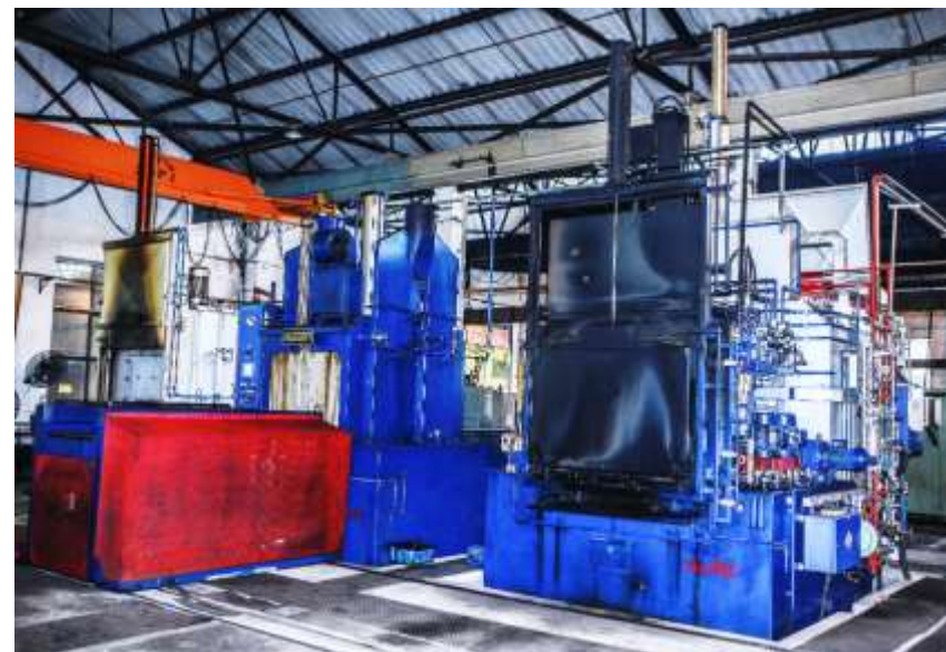
DÂY CHUYỀN NHIỆT LUYỆN (2.000 tấn/năm)