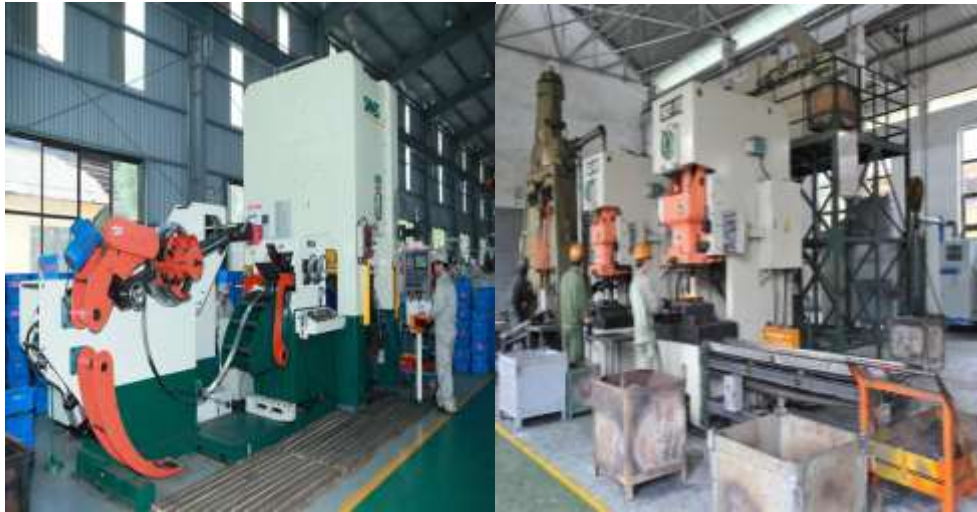
DÂY CHUYỀN DẬP (6.500 tấn/năm)