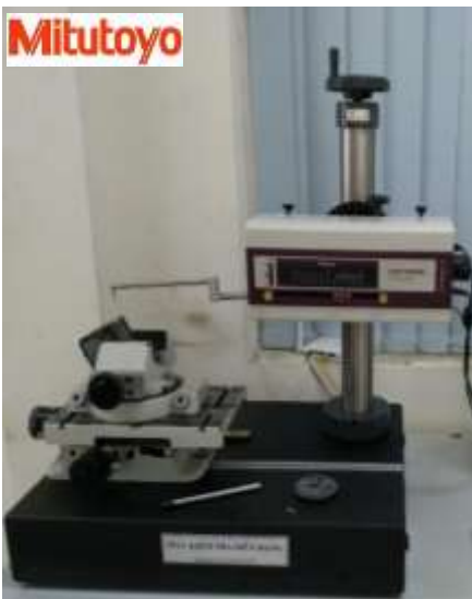
CÀ BIÊN DẠNG